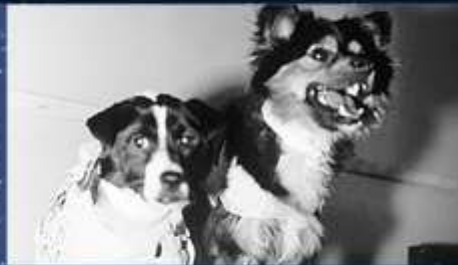
ВЕТЕРОК И УГОЛЁК