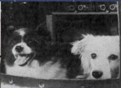
ДЕЗИК И ЦЫГАН