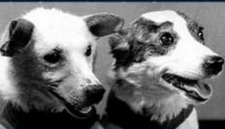
БЕЛКА И СТРЕЛКА