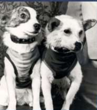
БЕЛКА И СТРЕЛКА