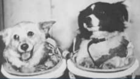
ДЕЗИК И ЦЫГАН