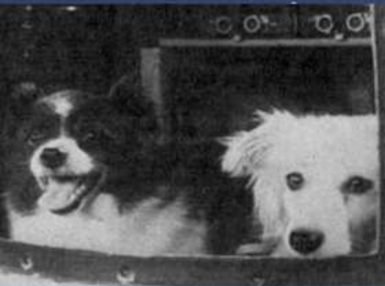
ДЕЗИК И ЦЫГАН